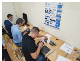
Проведение практического экзамена по ультразвуковому контролю