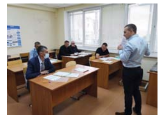
Проведение конкурса по ультразвуковому контролю