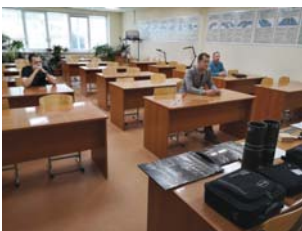
Проведение экзамена по визуально-измерительному методу НК

Основной задачей Тюменского областного регионального отделения РОНКТД является профессиональное обучение методам неразрушающего контроля.