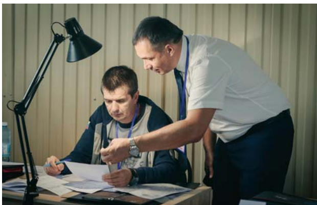
Фото с региональных этапов конкурса