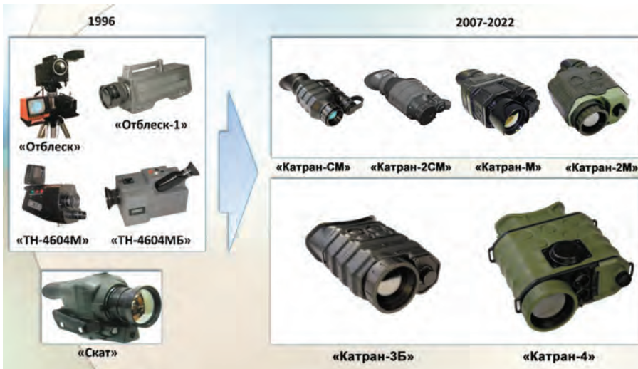
Рис. 8. Неохлаждаемые тепловизионные средства производства Спецотдела № 6 и НПЦ «Спектр-АТ»

стемы (ТС) относятся к классу «наблюдательные» или «поисковые» и условно, в соответствии с общепринятой классификацией, делятся на три основные группы: