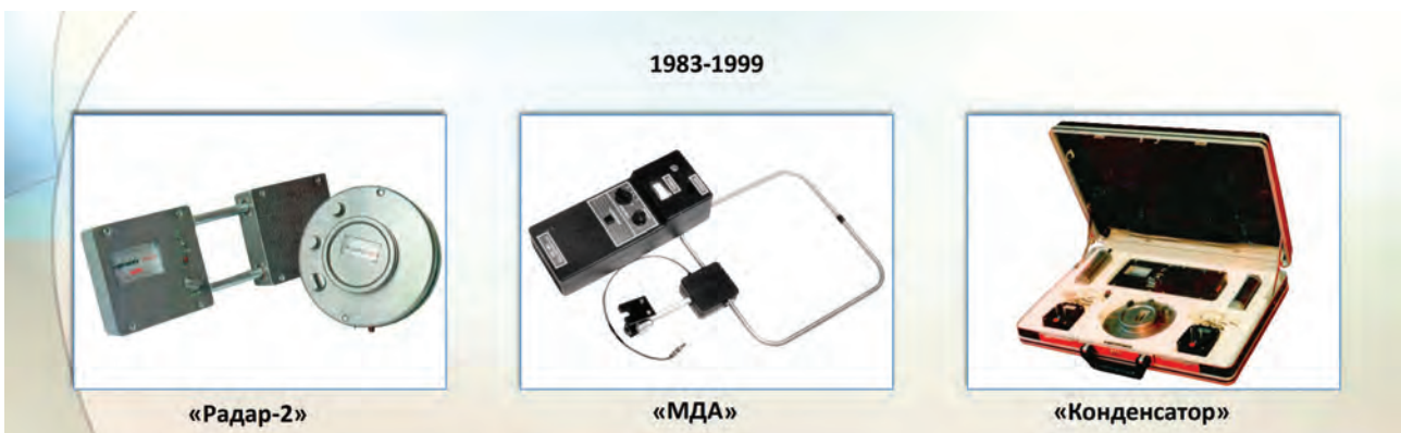
Рис. 2. Основные результаты работы радиоволнового сектора

Основным итогом работы этого направления, функционировавшего достаточно короткий период, было создание ряда комплектов радиоволновой аппаратуры серий «КОНДЕНСАТОР», «РАДАР» и МДА (рис. 2), предназначенной для обнаружения и определения местоположения токопроводящих и диэлектрических включений, а также конструктивных и искусственных пустот в строительных конструкциях из бетона, железобетона, кирпича и дерева. С помощью этой аппаратуры можно выявлять местоположение скрытой провод-