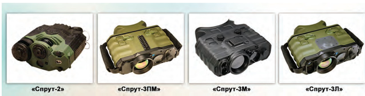
Рис. 10. Портативная многоканальная мультиспектральная аппаратура серии «Спрут»

чественного наблюдения и разведки в любое время суток и в любых погодных условиях на расстояниях от десятков до тысяч метров. Аппаратура серийно выпускается и поставляется в силовые структуры и органы безопасности.