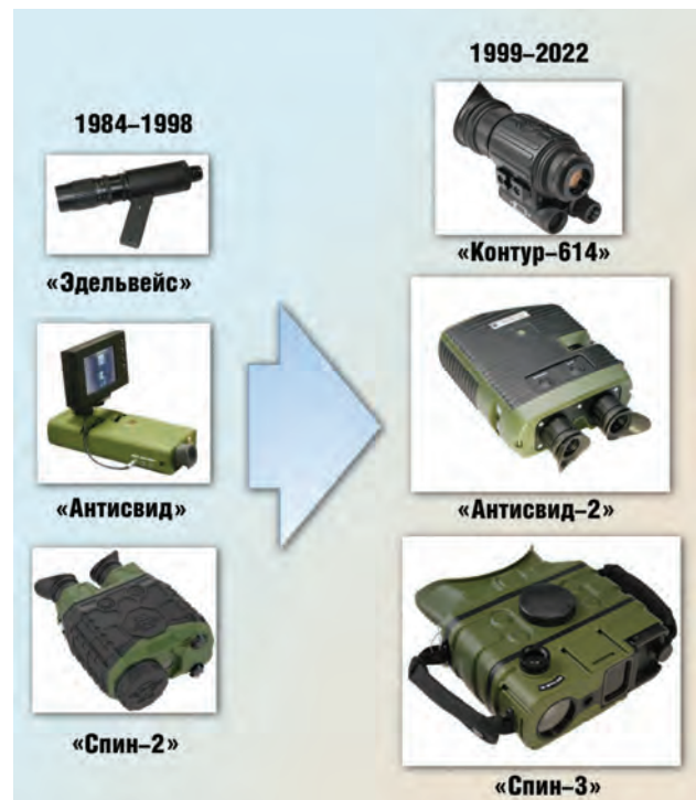
Рис. 7. Аппаратура наблюдения и контроля

На рис. 6 представлены некоторые образцы криминалистической техники разных периодов разработки, позволяющие оценить уровень прогресса в создании такой аппаратуры.