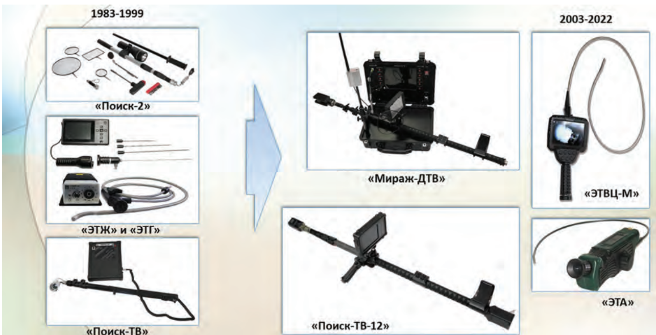
Рис. 5. Поисково-досмотровое оборудование

В 1978 г. коллективу Спецотдела была сформулирована задача, заключающаяся в необходимости создания переносных приборов и стационарных комплексов для поиска скрытых дефектов и посторонних вложений в плоских диэлектрических материалах, выявления подчисток и исправлений в документах и ценных бумагах. В рамках этого на-