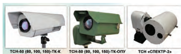
Рис. 11. Стационарные одно- и двухканальные оптико-электронные системы серии TCH

Источником зондирующего излучения в оптико-электронной системе «Спрут-3Л» является полупроводниковый лазер с рабочей длиной волны 808 нм, работающий в импульсном режиме. Лазерное зондирующее излучение сформировано в узкую вертикальную полосу, отражение которого занимает небольшую часть централь-