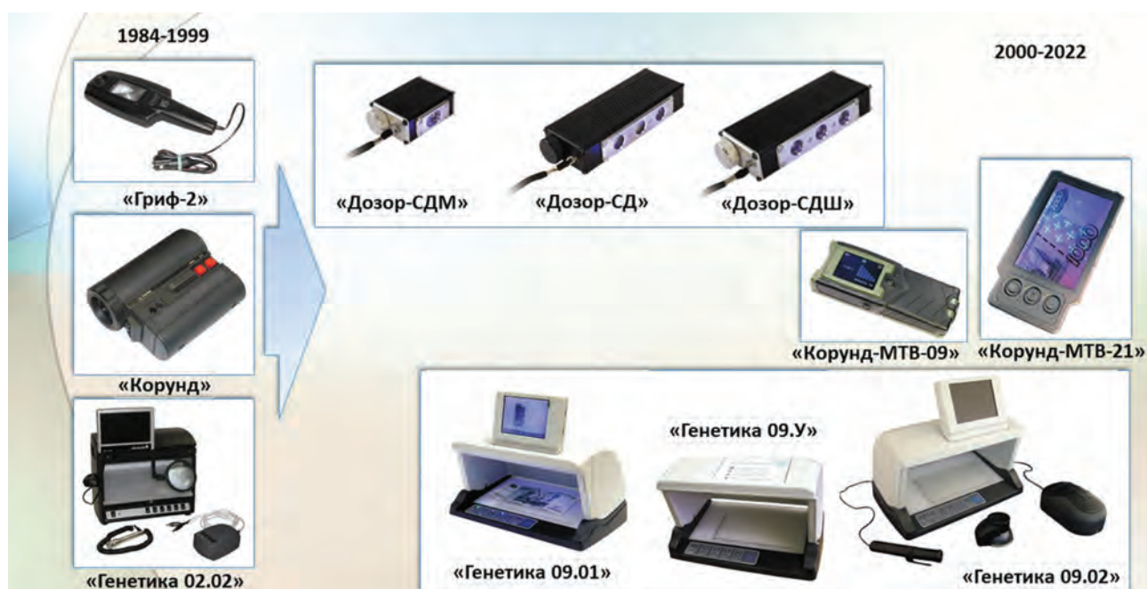
Рис. 6. Продукция Спецотдела № 6 и НПЦ «Спектр-АТ»

правления к 1984 г. были разработаны и серийно выпускались такие поисковые средства, как «Торнадо-И», уникальный малогабаритный прибор «Ореол», в течение многих лет стоявший на вооружении правоохранительных органов, стационарные комплексы «Тула», «Абакан», «Тюк» в комплекте со вспомогательными приборами «Топсель-У» и «Топсель-В».