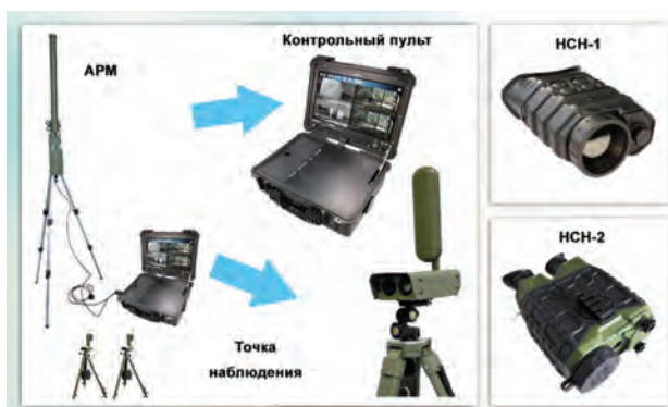
Рис. 12. Быстроразвертываемый мобильный комплект охранного наблюдения «Спектр-С»

дение, в то время как тепловизионные системы предназначены для обнаружения различных целей.