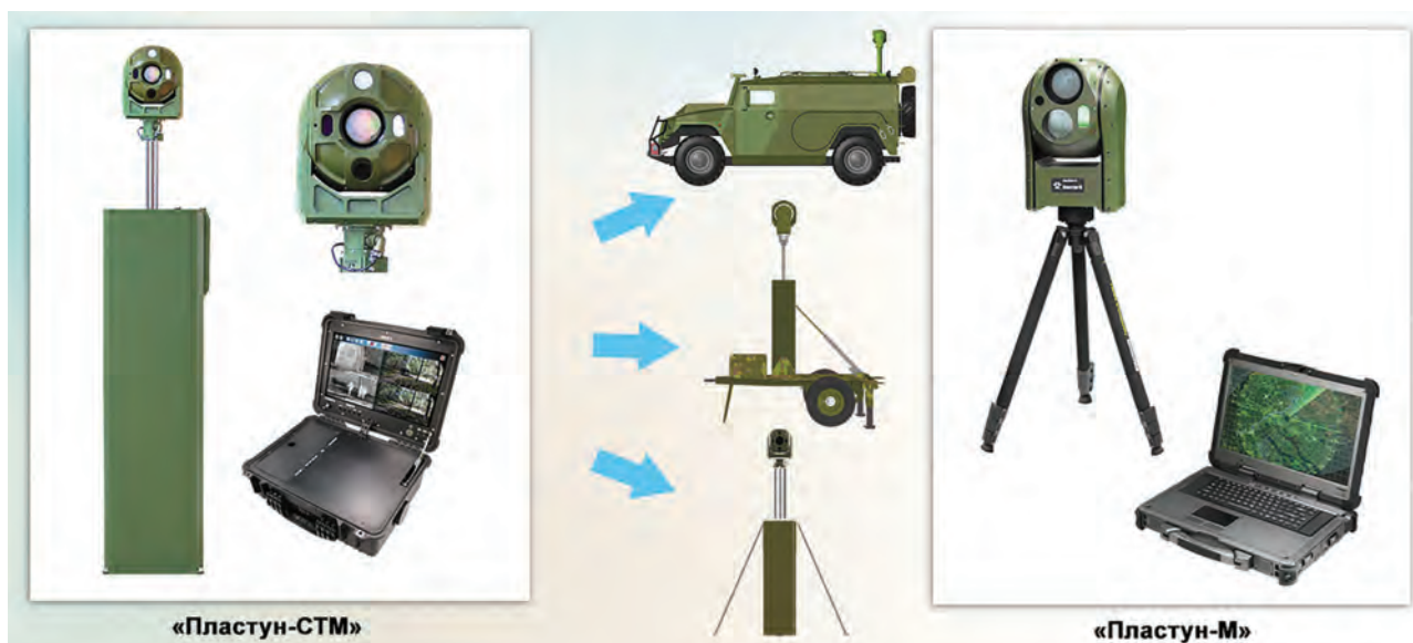
Рис. 13. Многоканальный мультиспектральный оптико-электронный комплекс наблюдения и разведки «Пластун-СТМ» и «Пластун-М»

Быстро разворачиваемые системы охраны (БРСО) относятся к аппаратным средствам охранной сигнализации и предназначены для контроля периметров временных полевых объектов, отдельных рубежей или зон. В зависимости от типа используемых сенсоров все БРСО делятся на классы, принадлежность к которым определяется физическим принципом работы и собственно используемым датчиком: СВЧ-лучевой, инфракрасный (ИК), емкостной, вибрационный, акустический и т.п.