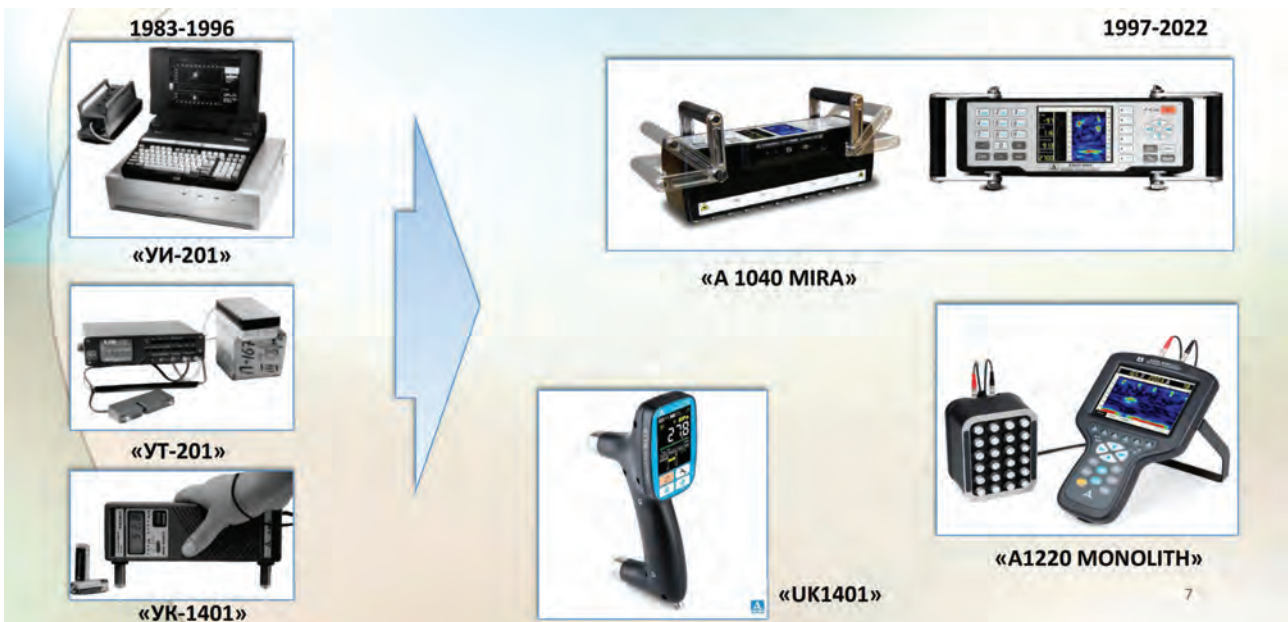
Рис. 3. Первые разработки акустического сектора и современная продукция «АКС»