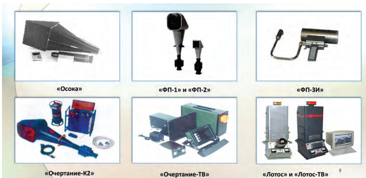
Рис. 4. Результаты разработок сектора радиационных методов контроля

были приняты на вооружение правоохранительных органов и силовых структур и стали базовыми изделиями в серии портативных флуороскопов, созданных во второй половине 1980-х гг.