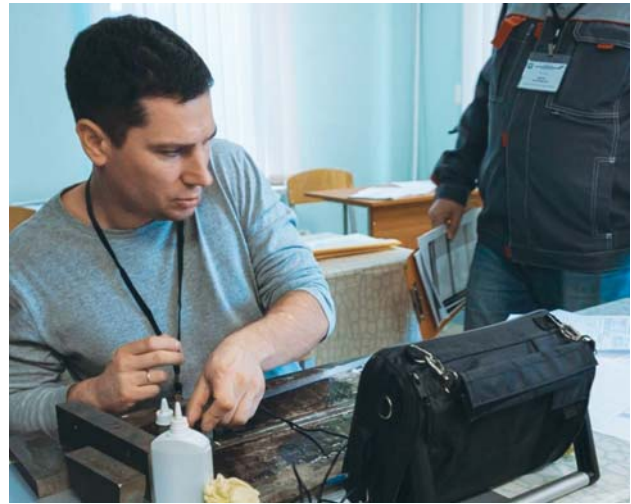
Рис. 2. Выполнение практического задания

ных конкурсантом при проведении НК и оформлении результатов. Данные из формуляров членов жюри заносились в автоматизированную систему, в которой проводился расчет оценки каждого участника, их ранжирование по занятым местам, оформление итогового протокола по номинации.