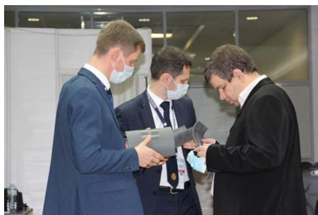
Рис. 9. Обсуждение апелляции членами жюри

Для наиболее малочисленной номинации по МК оказалось достаточным сформировать одно рабочее место. Задача финалистов состояла в проведении контроля одного и того же образца и определении с применением различных схем намагничивания участков с поверхностными дефектами (рис. 8).