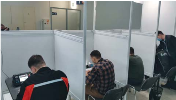
Рис. 6. Выполнение задания по ультразвуковому контролю