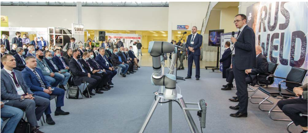
Рис. 4. Открытие финального этапа конкурса