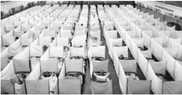
1918 г. Эпидемия испанки. Больные разделены тонкими перегородками в большом зале