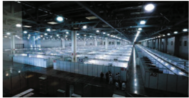
2020 г. COVID-19. Павильон «Крокус Экспо» переоборудован в дополнительный стационар в ожидании больных

ществует! Есть средства, которые работают параллельно и тем самым повышают эффективность общей борьбы с вирусом.