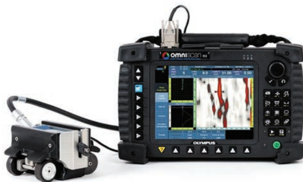
Рис. 1. Дефектоскоп OmniScanECA со сканером MagnaForm

Основное преимущество нового матричного вихревого преобразователя в сканере MagnaForm – динамическая компенсация величины зазора. Это достигается за счет использования двух типов катушек в одном матричном преобразователе. В итоге получаем эквивалентную чувствительность в разных зонах контроля под преобразователем, даже если расстояние от поверхности до измерительных катушек переменное.