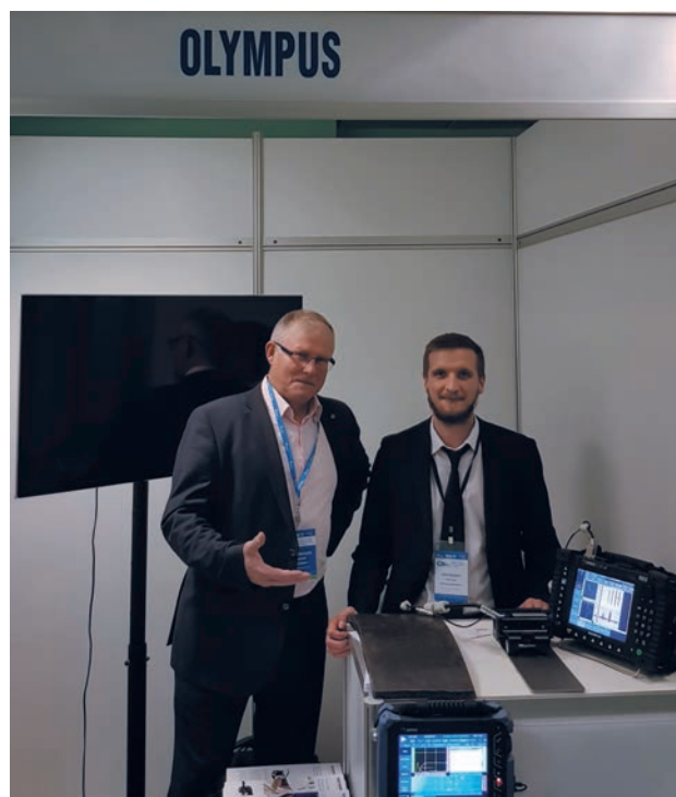
Рис. 3. Демонстрация работы сканера MagnaForm на реальных образцах с натуральными трещинами от КРН в рамках IX отраслевого совещания «Состояние и основные направления развития сварочного производства ПАО «Газпром»

технологии ВТМ подробно описаны на сайте компании https://www.olympus-ims.com/ru/ . По любым дополнительным вопросам, связанным с тематикой данной статьи, просьба обращаться в департамент промышленного оборудования компании ООО «Олимпас Москва» – официального представителя компании OLYMPUS в России и странах СНГ.