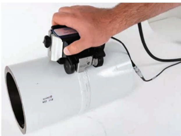
Рис. 2. Результаты контроля с помощью сканера MagnaForm